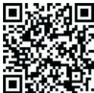
“升小业”微信二维码