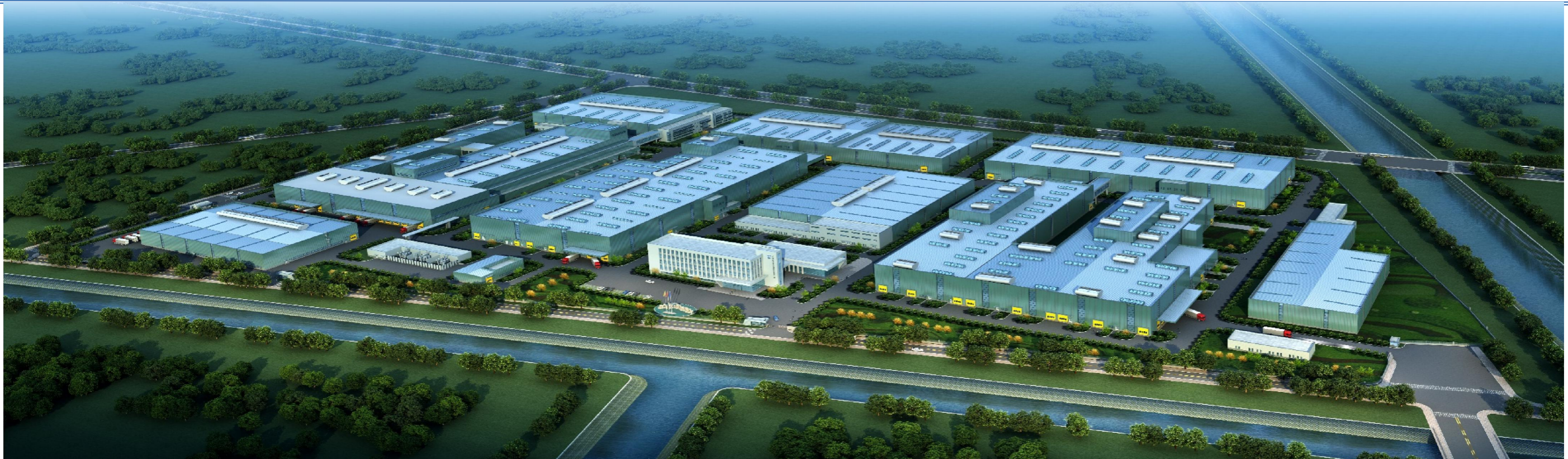
Shanghai St. DMAn casting project 上海圣德曼铸造项目