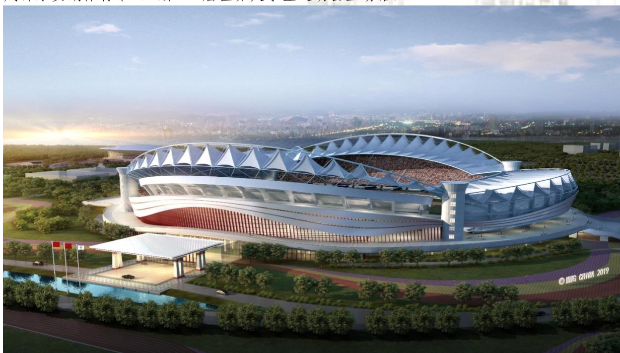
武汉体育中心 VIP 改造项目（第七届世界军人运动会主场馆）