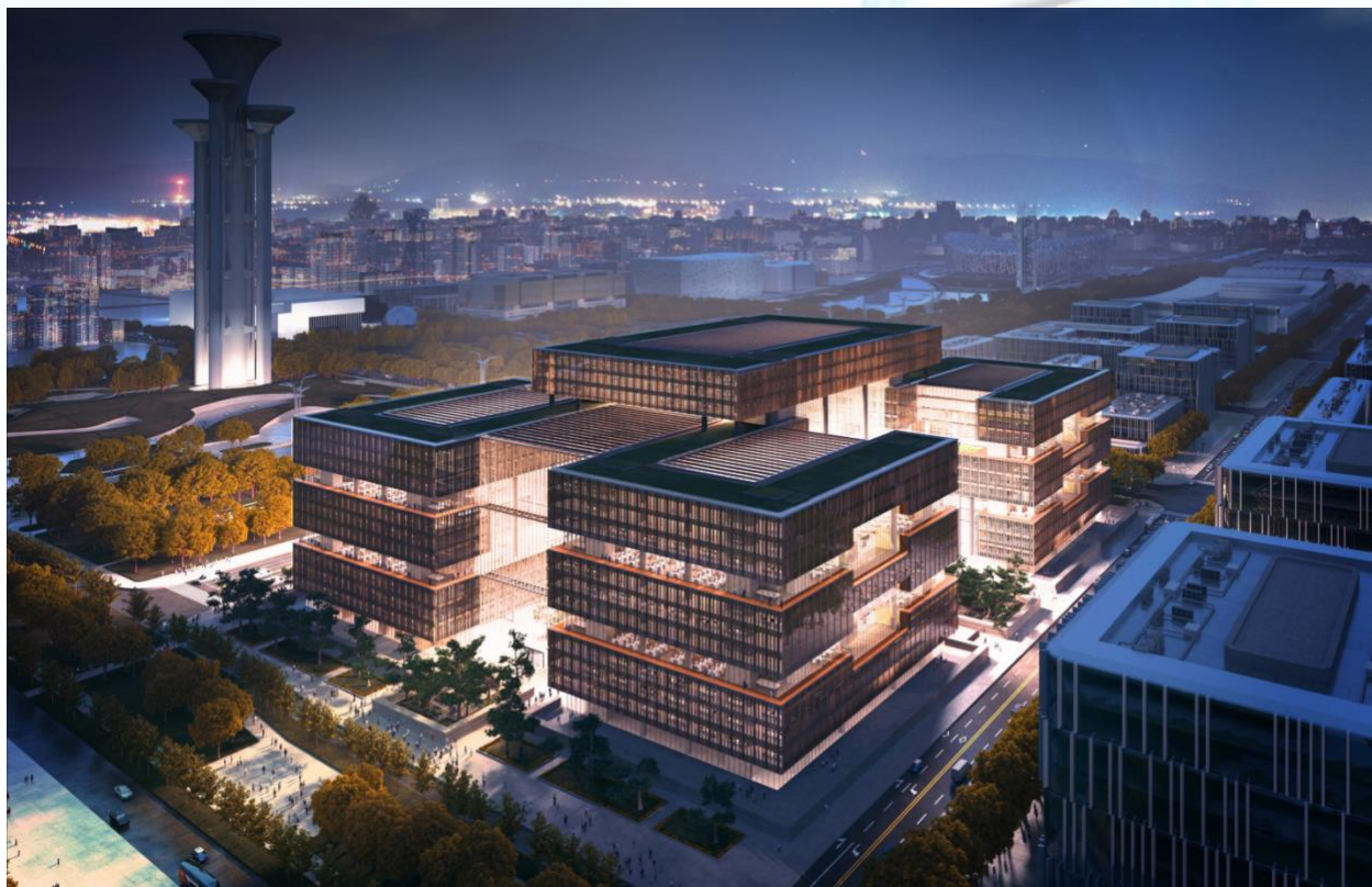
亚洲基础设施投资银行总部永久办公场所项目