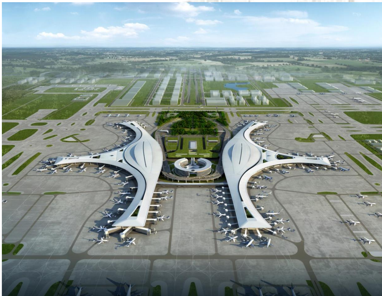
成都天府国际机场 T1 航站楼项目