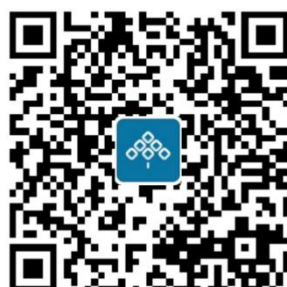
线上网申 | 一键扫码