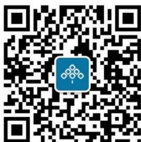
碧桂园服务招聘微信公众号