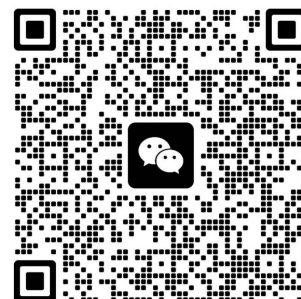
碧服 27 届 | 校招交流群