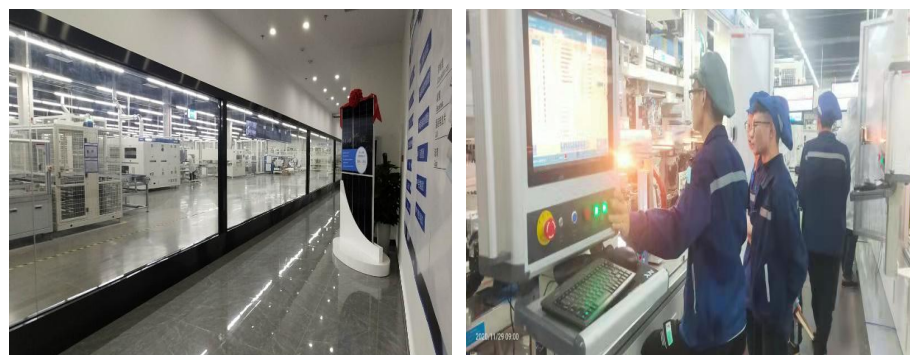
自动智能化工作车间