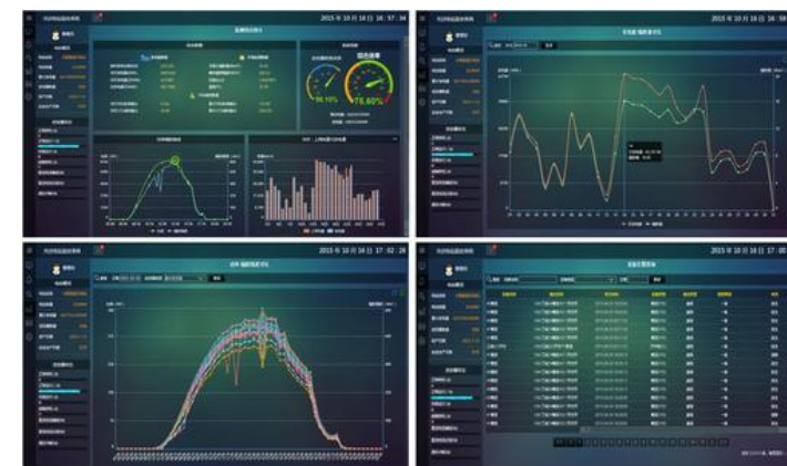
智能制造阿里云大数据分析系统