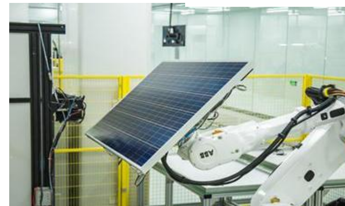
全自动机器人组件生产线